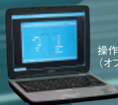
操作用パソコン (オプション)